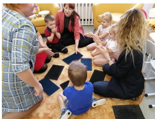
Фото 2. Каждый ребенок охвачен специалистом (на фото занятие с учителем-логопедом, учителем-дефектологом)