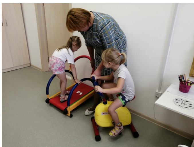
Фото 6. Общее фото (специалисты и дети)